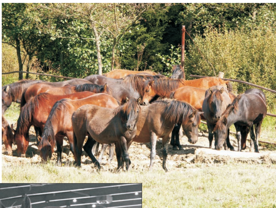
Stado koni huculskich A herd of Hucul horses