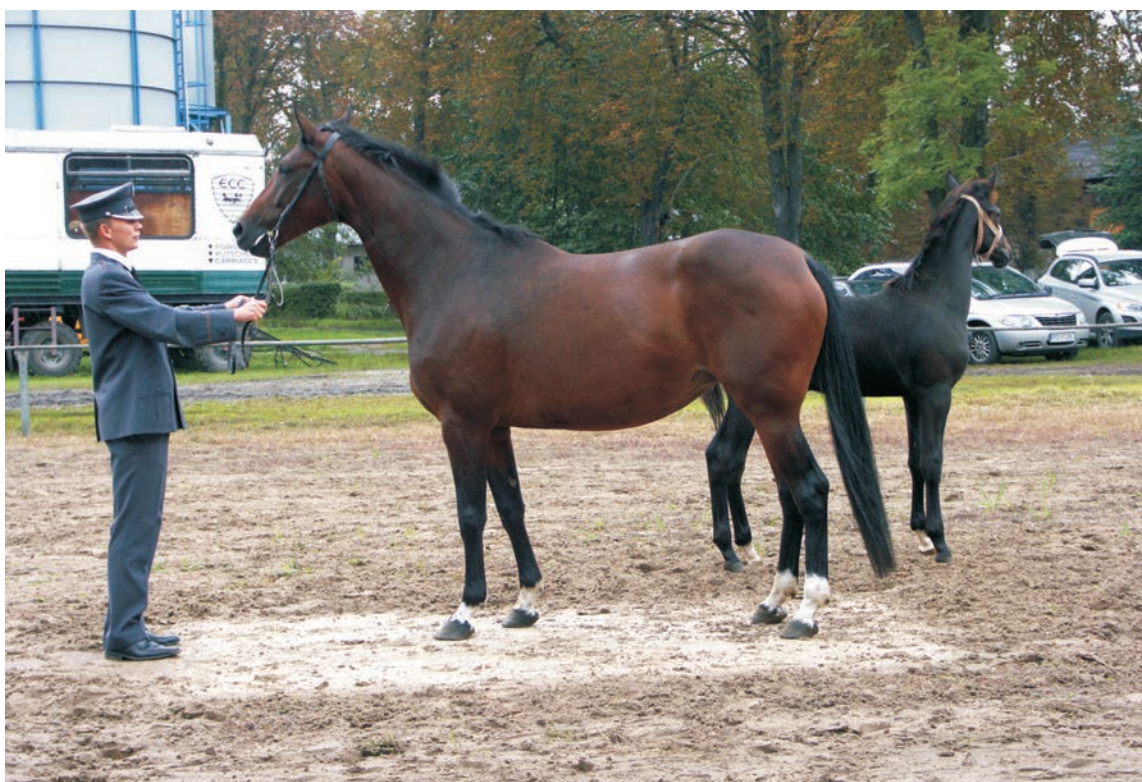
Klacz wielkopolska ze źrebkiem – Wielkopolski mare with a foal