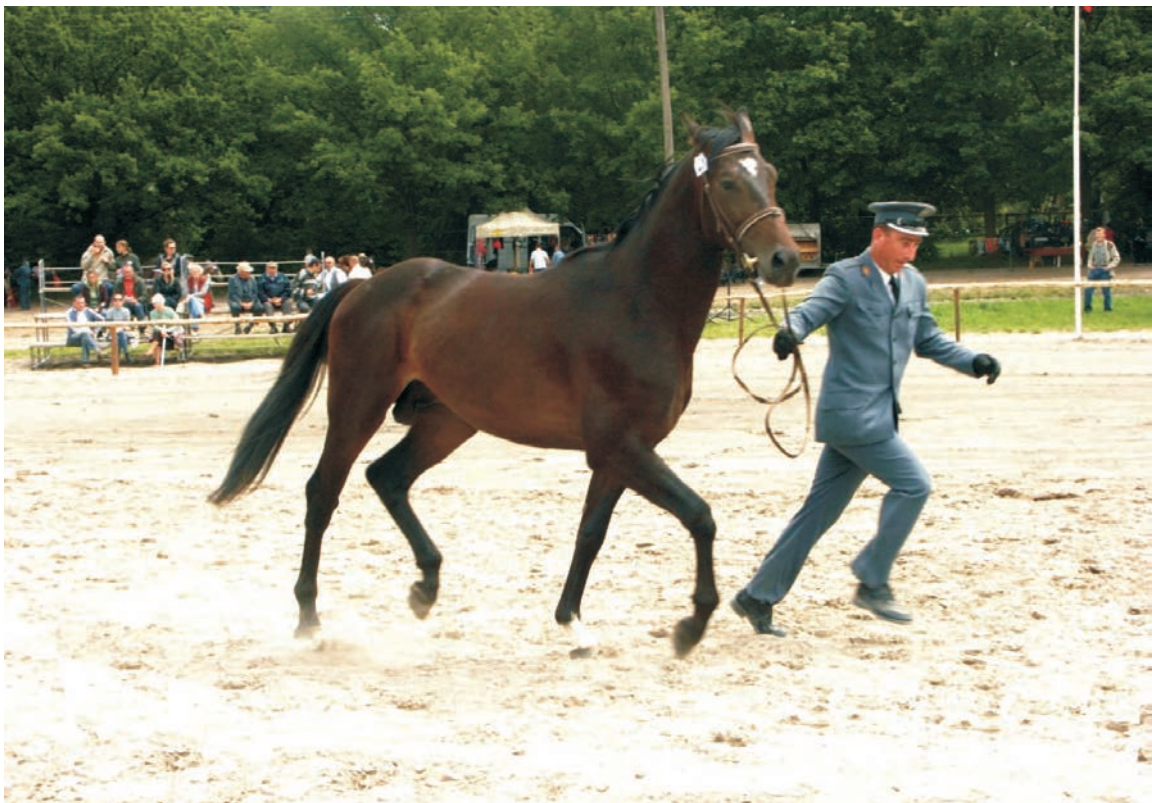
Konie rasy wielkopolskiej – Wielkopolski horses