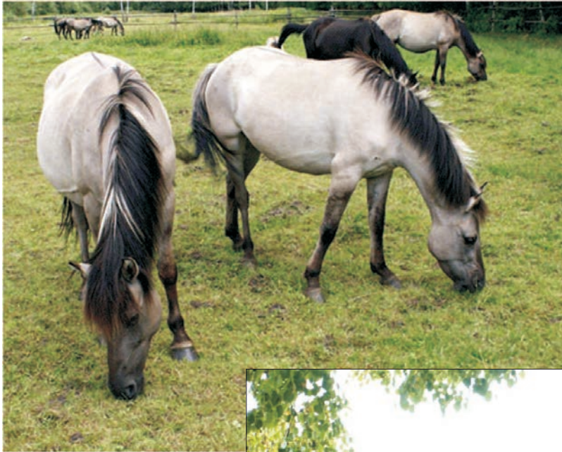
Klaczce rasy konik polski Polish Konik mares