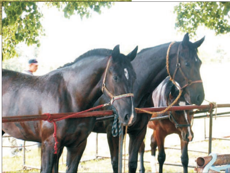
Klaczce rasy śląskiej – Silesian mares (fot. I. Tomczyk-Wrona)