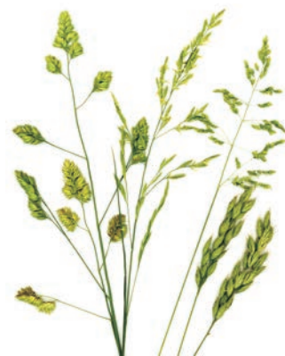
Koń sztumski Sztumski stallion