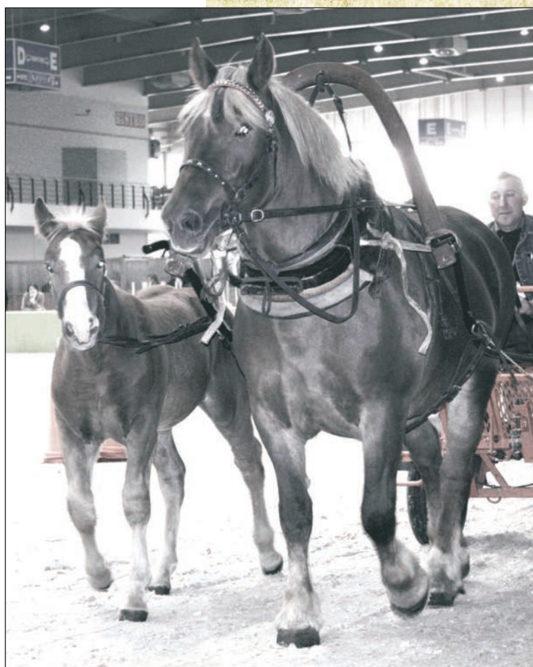
Klacz sokóleńska ze źrebkiem Sokółski mare with a foal