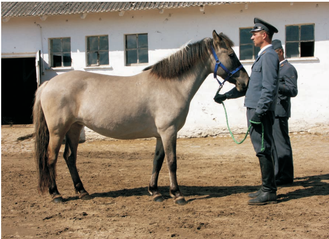
Klacz ras konik polski – Polish Konik mare