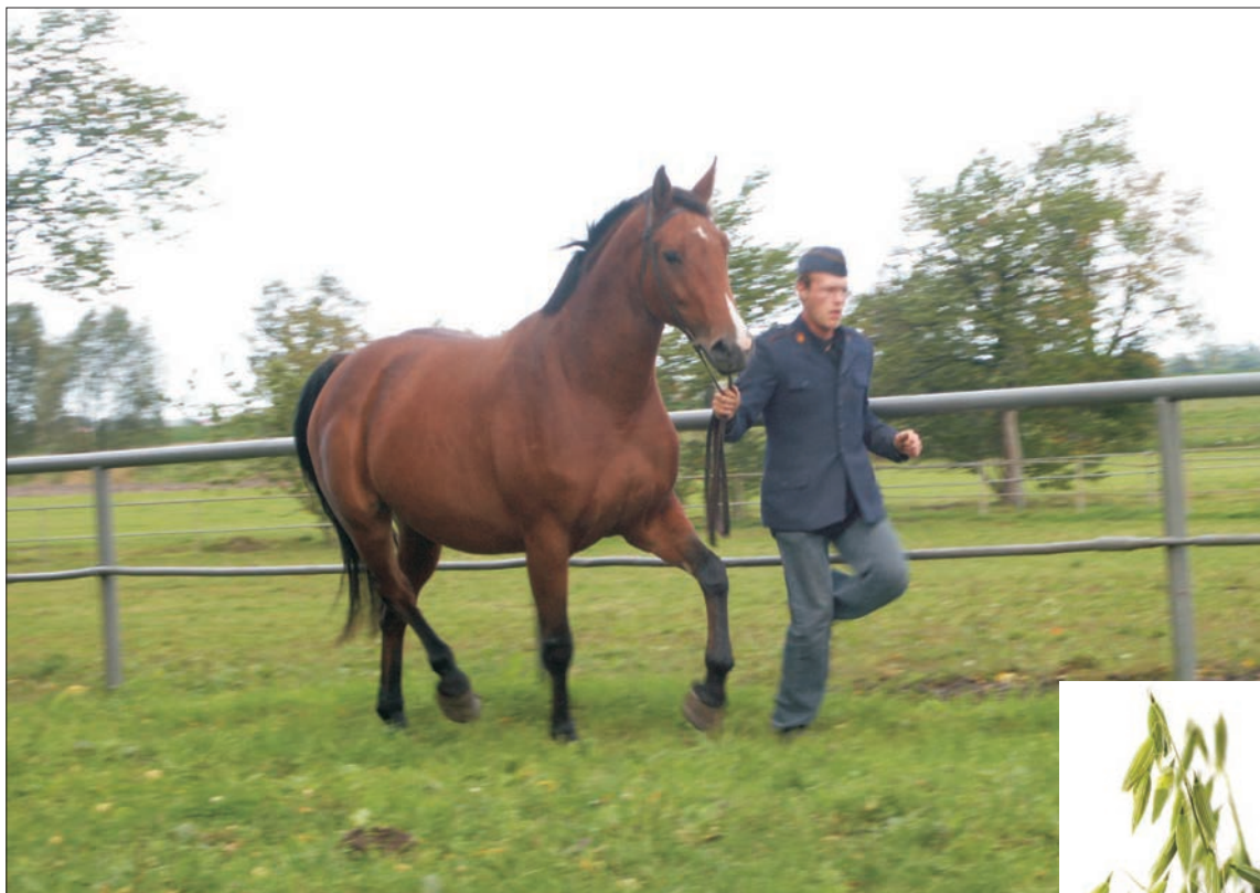
Ogier wielkopolski – Wielkopolski stallion