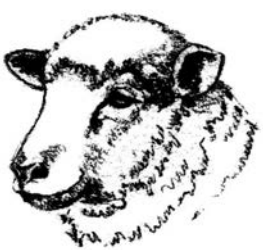
Tuczony tryczki rasy merynos barwny i mieszańce F_1 po Ile de France Fattened Coloured Merino ram lambs and Ile de France F_1 sheep