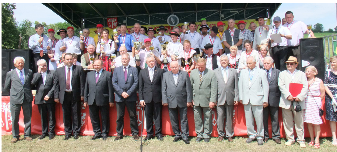
Nagrodzeni hodowcy, zaproszeni goście i organizatorzy VII Krajowej Wystawy Czerwonego Bydła Polskiego na Błoniach Szczyrzyckich