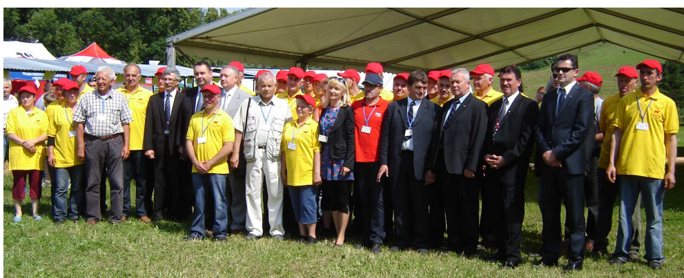
Wystawcy – hodowcy bydła i organizatorzy Wystawy