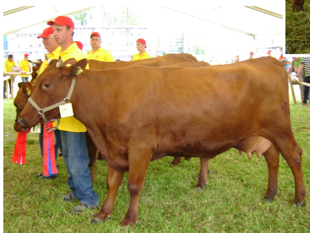
Czempionka, krowa WATRA – pierwiastka z programu doskonalenia rasy z hodowli E. i W. Łukaszów (Krempachy)