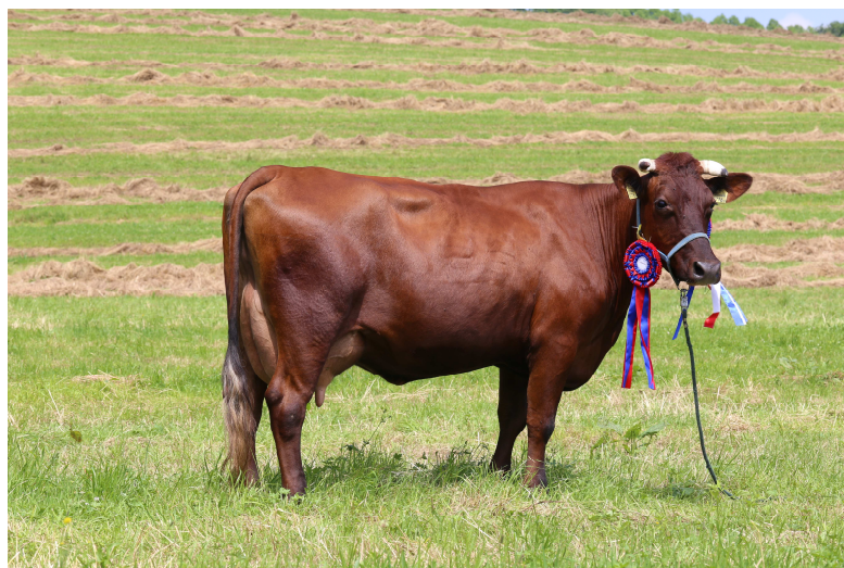
Super czempionka Wystawy – krowa WISNIA (program ochrony zasobów genetycznych) z hodowli M. Staniszewskiego (Zawadka)