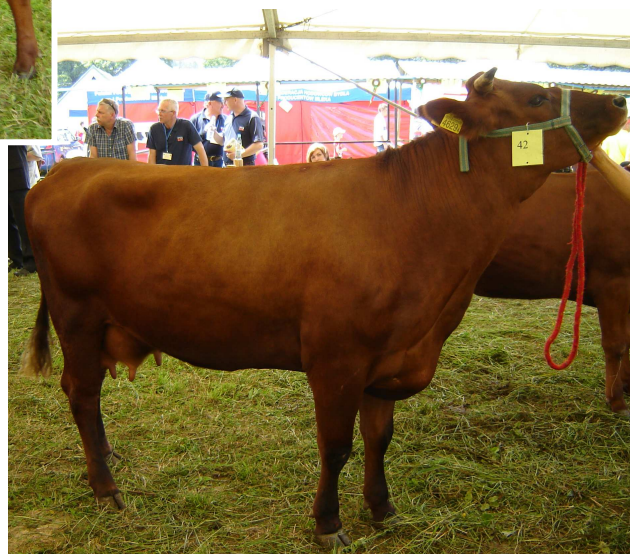
Czempionka, krowa POLA – pierwiastka z programu ochrony zasobów genetycznych, z hodowli OHZ Przerzeczyn Zdrój, obora Gilów