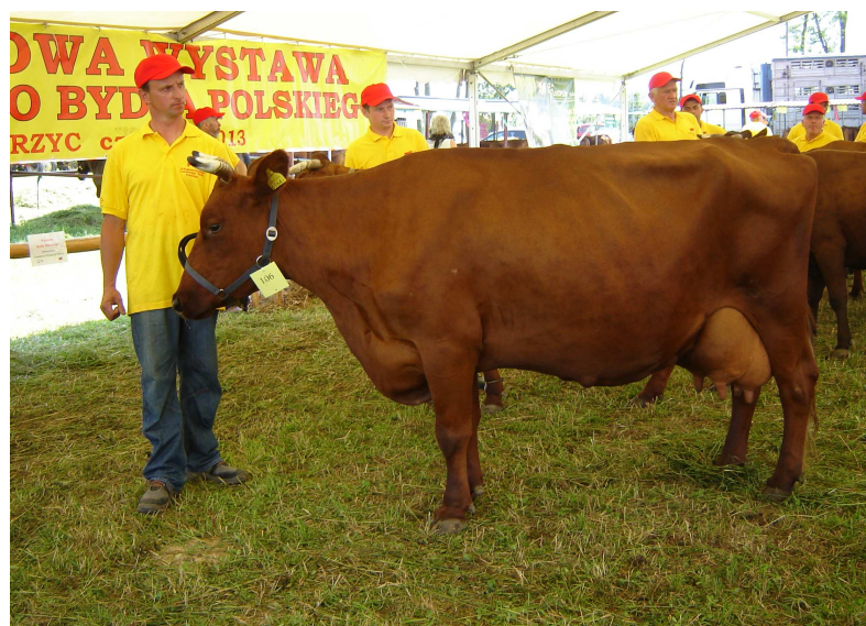
Super czempionka Wystawy – krowa WERA (program doskonalenia rasy) z hodowli E. i W. Łukaszów (Krempachy)