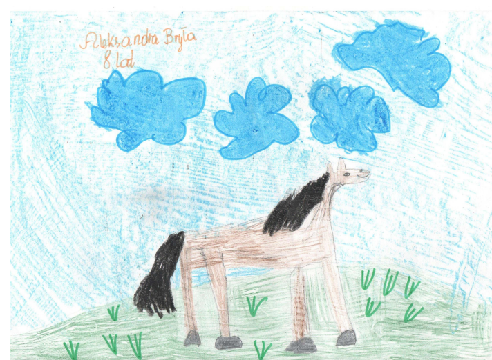
Młodzi hodowcy oraz prace nagrodzone w konkursie plastycznym dla dzieci Przy koniu: Marzena Górską z klaczą TYKWA, czempionką hodowlaną klaczy dwuletnich Wystawy w Szczyrzycu