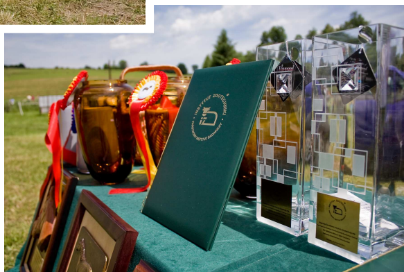
Nagroda Dyrektora IZ PIB, krajowego koordynatora ds. ochrony zasobów genetycznych zwierząt, dla ogiera i klaczy – najlepszych w typie huculskim