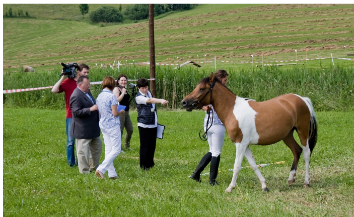
Prace komisji sędziowskiej podczas oceny koni „na płycie”, filmowane przez TVP Kraków