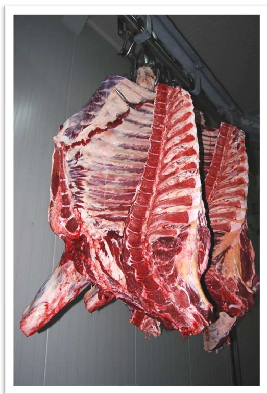
Cwierćtusza przednia, bydło rasy Hereford Forequarter, Hereford cattle