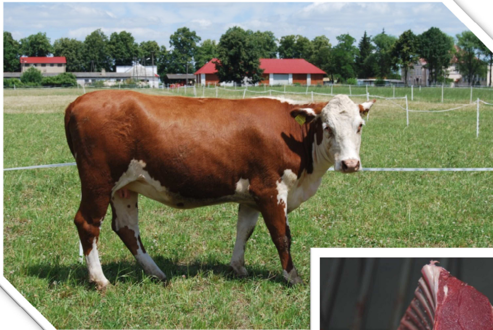
Antrykot, bydło rasy Hereford Prime rib, Hereford cattle