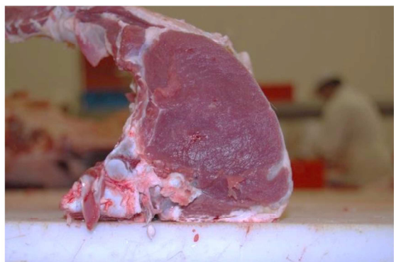
Rostbef, bydło rasy Limousine Rump cut, Limousin cattle