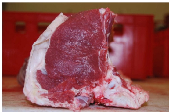
Rozbratel, bydło rasy Limousine Fore rib, Limousin cattle