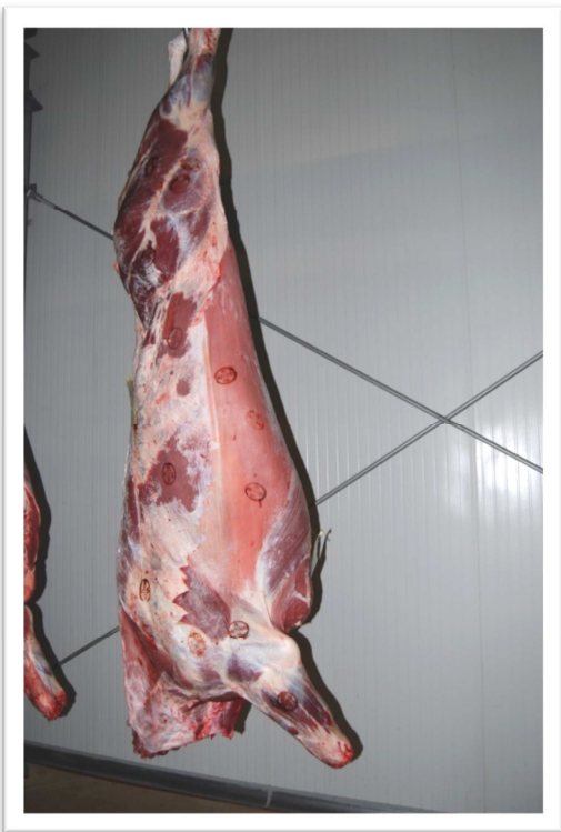
Półtusze, bydło rasy Limousine Half-carcases, Limousin cattle