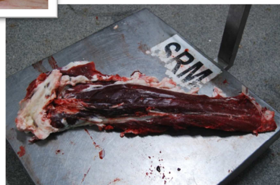
Polędwica, bydło rasy Limousine Tenderloin, Limousin cattle