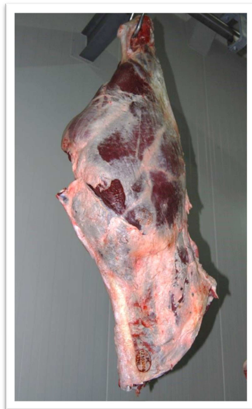
Cwierćtusza tylna, bydło rasy Hereford Hindquarter, Hereford cattle