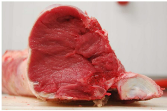
Antrykot, bydło rasy Limousine Prime rib, Limousin cattle