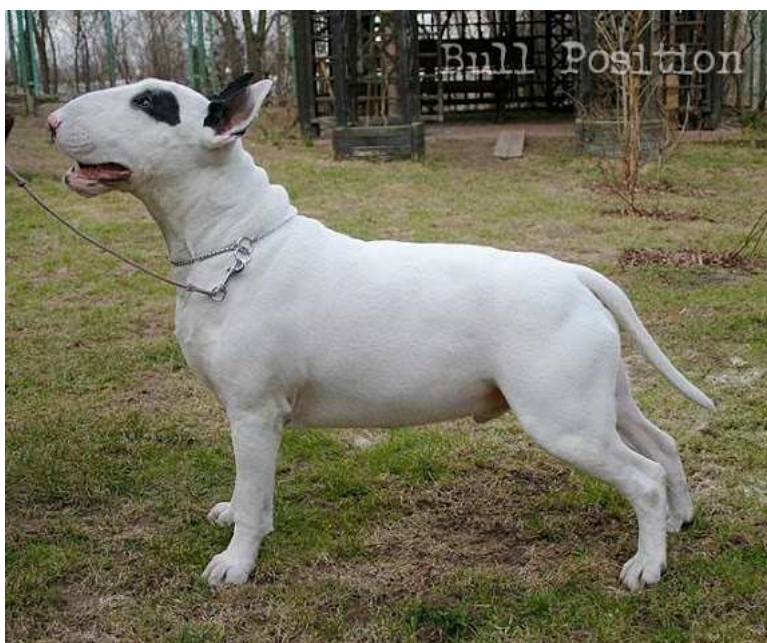
Fot. 4. Samiec bulterier – Dutch Deity Bull Position. Hodowla Bull Position, Elwira Cetner-Kita

Photo 3. American Staffordshire terrier male – Gang Staff Wild Thing. Gang-Staff Kennel Breeding, Agata Kalicińska