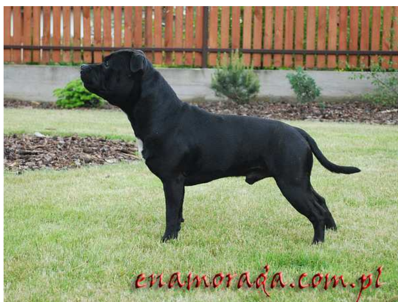
Fot. 1. Samiec rasy staffordshire bull terrier – Dragon Bullerbyn Fransimo Bohemia.

mianem idealnych dla rodzin z dziećmi. W swojej ojczyźnie mogą pochwalić się opinią psianiańki ze względu na okazywaną czułość i spokój. Temperament terriera przekłada się na cechy rozplodowe tych psów, gdyż cieszą się opinią czempionów reprodukcji. Z powodu pierwotnego wykorzystania do walk, wskazane jest u tej rasy przeprowadzenie szkolenia, przynajmniej w podstawowym zakresie (Monkiewicz i Wajdzik, 2003).