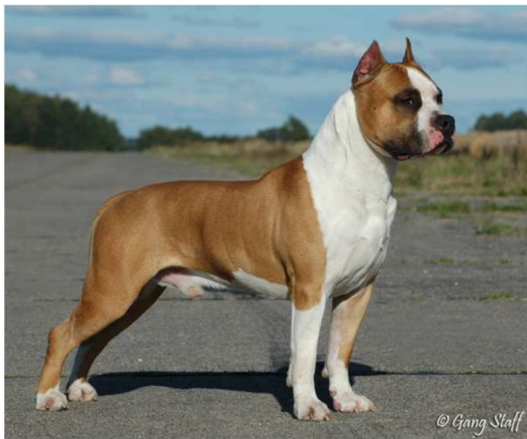
Fot. 3. Samiec rasy American staffordshire terrier – Gang Staff Wild Thing. Hodowla Gang-Staff Kennel, Agata Kalicińska

Photo 3. American Staffordshire terrier male – Gang Staff Wild Thing. Gang-Staff Kennel Breeding, Agata Kalicińska