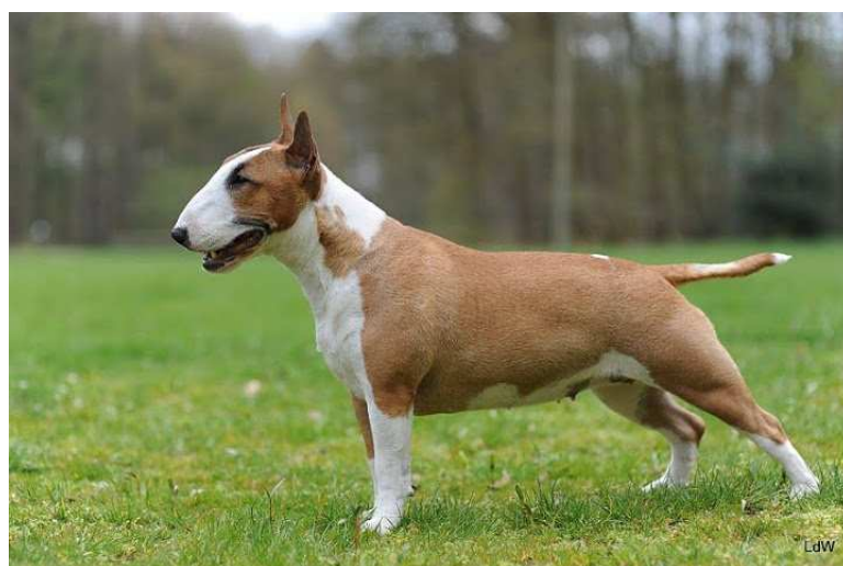
Photo 2. Miniature bull terrier female – Explosion Sunflower Power Kia. Bull Position Breeding, Elwira Cetner-Kita