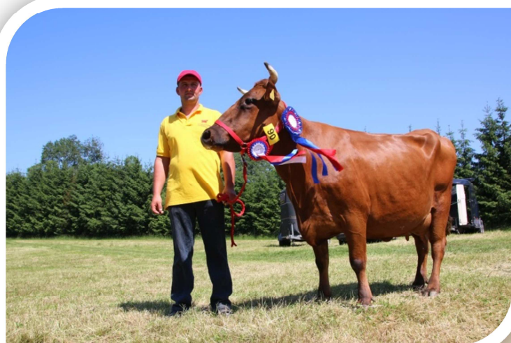
Krowa PYZA (hod. J. Król, Męcina) – superczempion Wystawy z programu ochrony zasobów genetycznych