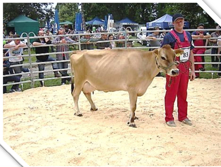
Krowa rasy Jersey