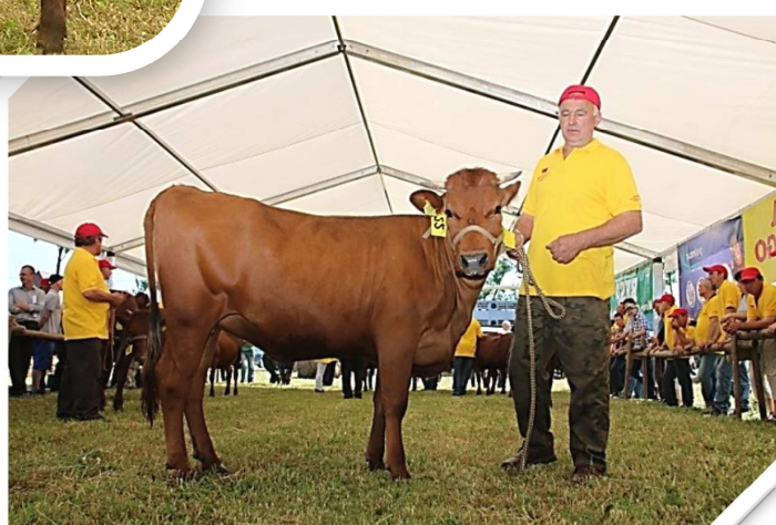
Jałówka TYROLA (hod. C. i A. Suktowie, Poręba) – czempion w grupie jałowic w wieku 17–20 mies.