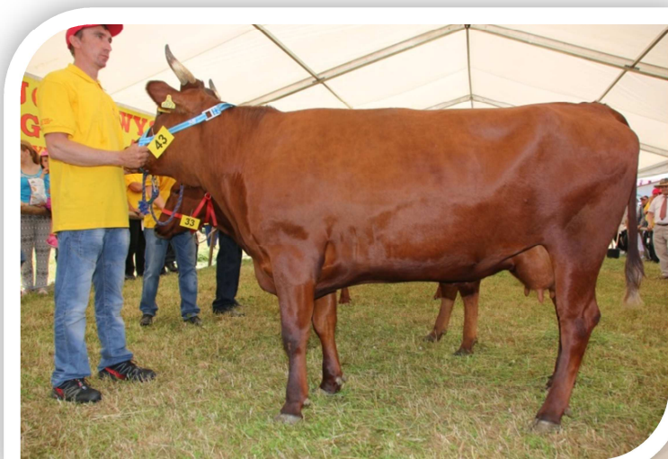
Krowa GAZELA (hod. OHZ Przerzeczyn Zdrój, Gilów) – czempion w grupie krów pierwiastek z programu ochrony zasobów genetycznych