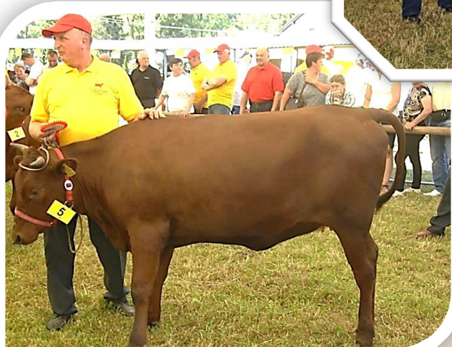
Jałówka ARONIA (hod. K. Satola, Wola Wieruszycka) – czempion w grupie jałowic w wieku 12–16 mies.