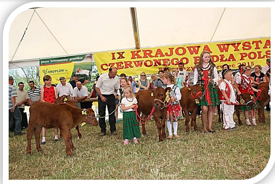
Konkurs „młodego hodowcy”