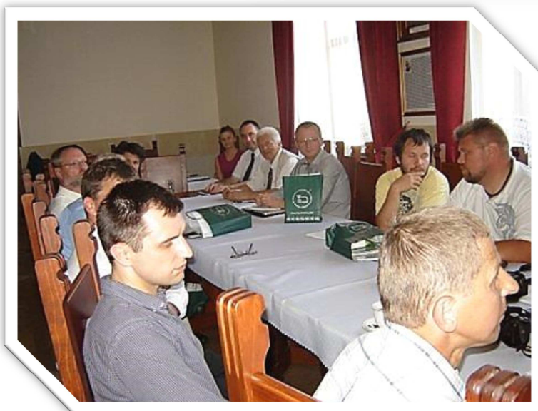
Spotkanie z gośćmi zagranicznymi na temat ras zachowawczych bydła