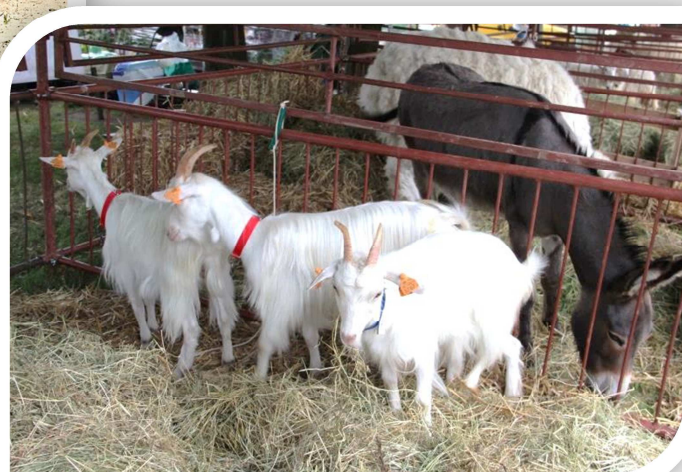
Kozy karpackie (czempion w środku) z ZD IZ PIB