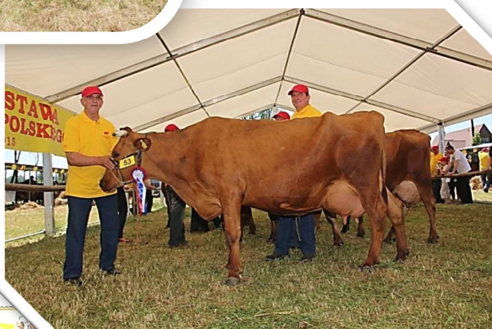
Krowa BIJA (hod. J. Solarczyk, Wróblówka) – superczempion Wystawy z programu doskonalenia rasy