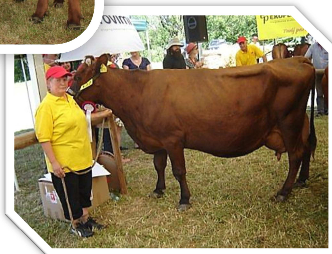
Krowa WIŚNIA 9 (hod. GR o.o. Cystersów, Szczyrzyc) – czempion w grupie krów w VI i wyższych laktacjach