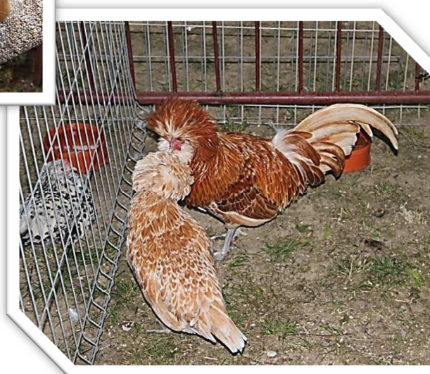
Drób kolorowy (nie na rosół!)