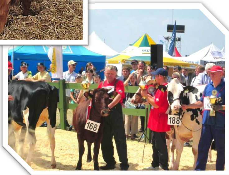
Czempion – jałowka nie cielna, Nr kat. 168