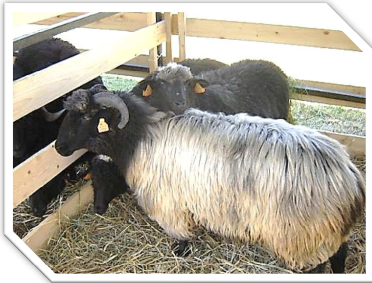
Polska owca górska odmiany barwnej