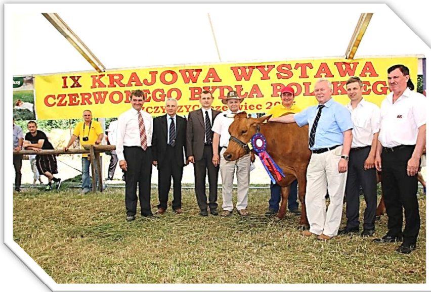
Organizatorzy Wystawy z superczempionką