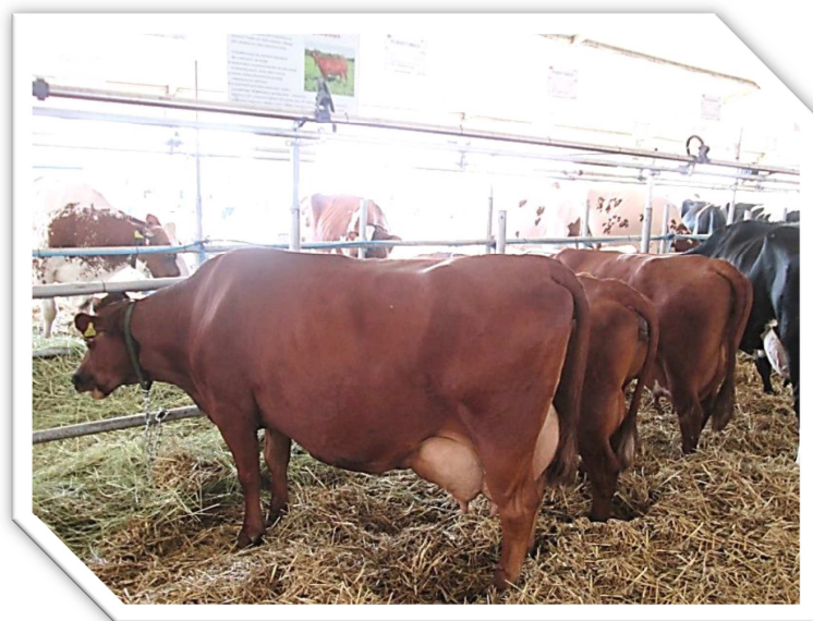
Krowa nr kat. 174, czempion rezerwy genetycznej