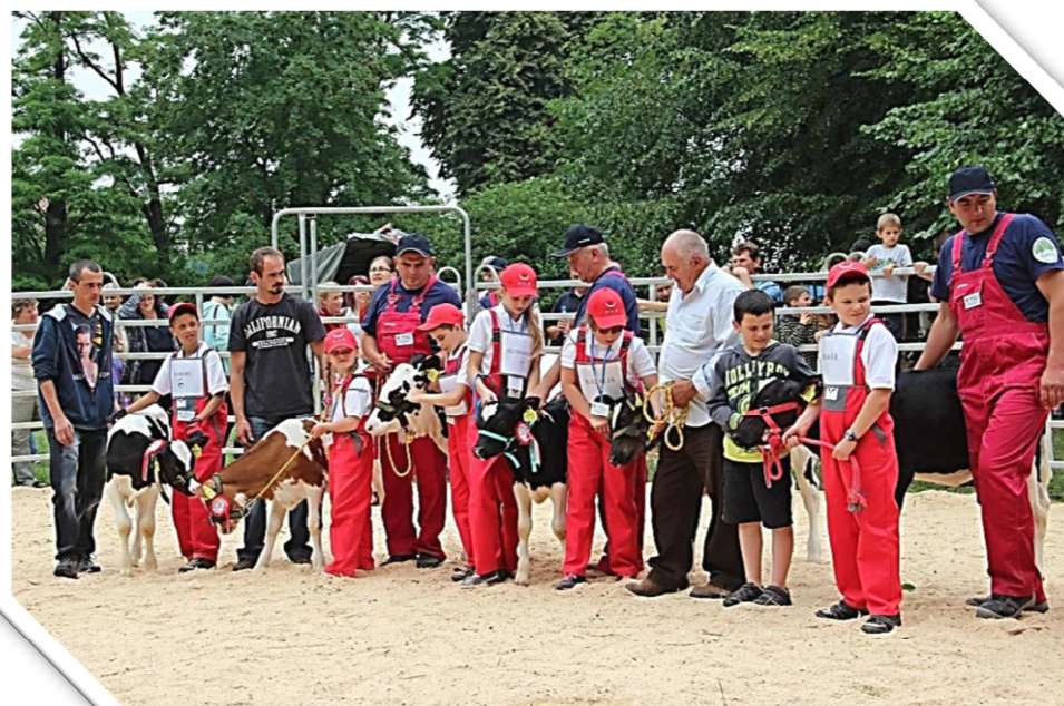
Konkurs Młodego Hodowcy