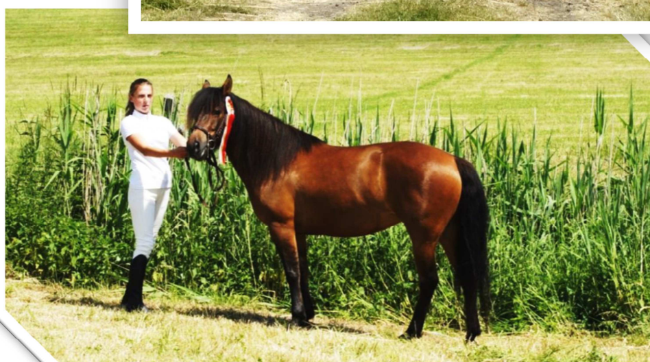
Zwycięzcy III Regionalnej Wystawy Koni Rasy Małopolskiej, Huculskiej, Śląskiej oraz Polski Koń Zimnokrwisty w Szczyrzycu, 2015