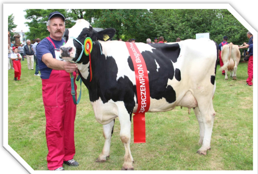
Krowa Jenesa, nr kat. 39 – supercampion z ZD IZ PIB Chorzelów