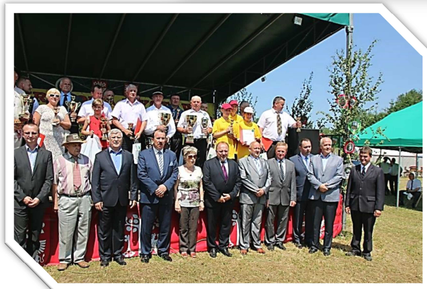
Wspólne zdjęcie zwycięzców i organizatorów Wystawy