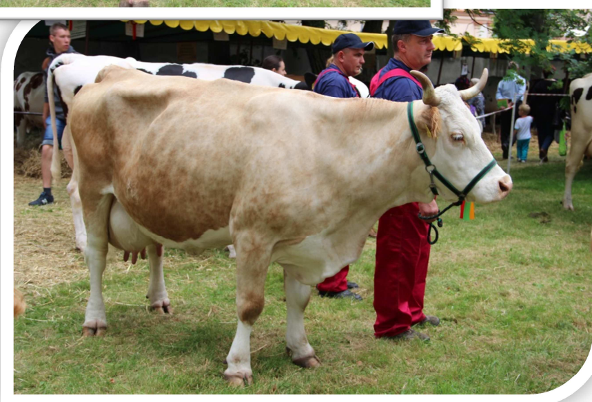
Krowa Brydzia, nr kat. 75 – czempion z hod. Krystyny Żarów z Bandrowa Narodowego