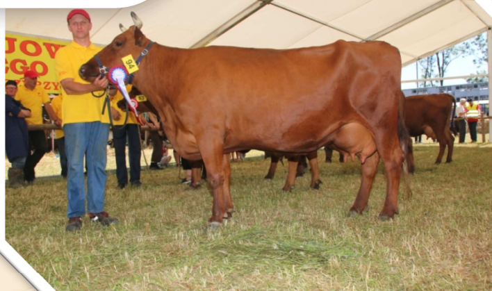
Krowa POLA (hod. E i W. Łukaszowie, Krempachy) – czempion w grupie krów w IV i V laktacji w programie doskonalenia rasy