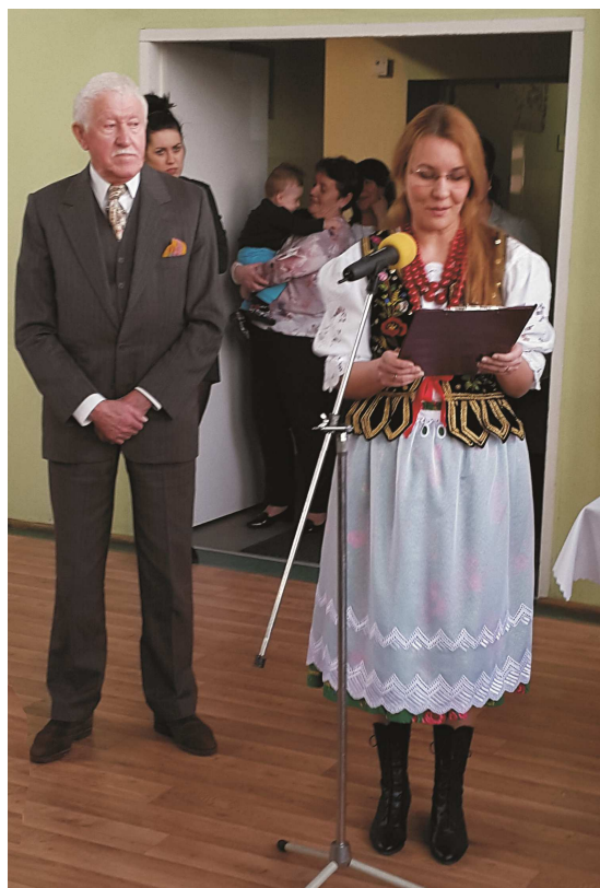
Wręczenie odznaczenia „Zasłużony dla Ziemi Balickiej“