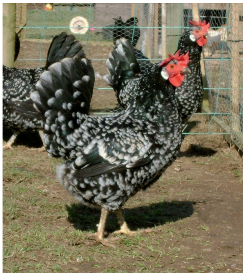
Fot. 1. Kury rasy ancona Phot. 1. Ancona chickens

Ze względu na stosunkowo wysoką nieśność kury tej rasy mają również pewien aspekt użytkowy (Moszczyński, 2012). Jaja mają śnieżnobiałą skorupkę i masę do 60 g. Badania Mugnai in. (2008) wskazują, że kury te są bardzo dobrymi nioskami w różnych systemach chowu, przy czym w chowie wybiegowym ich jaja cechuje wyższa masa oraz większa zawartość polifenoli, karotenoidów i \alpha -tokoferolu, co wynika z pobierania przez ptaki zielonych części roślin z wybiegu, będących źródłem tych cennych związków. Dal Bosco i in. (2011) wykorzystali ancony do krzyżowania z linią mięsną rasy cornish w celu uzyskania ptaków rzeźnych. Użyte mieszańce cechowała podobna wydajność rzeźna, ale lepsze umięśnienie oraz wyższa masa ciała i tuszki w stosunku do czysto rasowych osobników ancona.