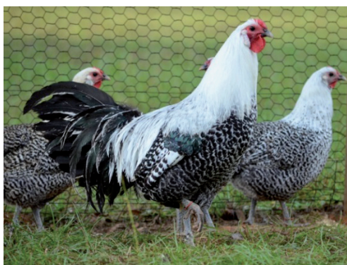
Fot. 13. Kogut i kury rasy westfalski totleger Phot. 13. Westfälischer Totleger rooster and hens greenfirefarms.com

W 2013 r. na terenie Niemiec pod opieką stowarzyszenia znajdowało się 250 kogutów i 1000 kur tej rasy (Kaszyński, 2016). Jest to populacja, która daje nadzieję na ocalenie rasy i rozpowszechnienie jej wśród hodowców nie tylko z Niemiec, ale i z innych krajów. W Polsce rasa ta występuje nielicznie. Totlegery wetsfalskie posiadają typowe dla ras kur wiejskich cechy budowy, jak: zaokrąglona i lekko wypięta do przodu pierś, wydarty brzuch i zwarte upierzenie nadające sylwetce smukły wygląd. Kogut posiada bujny ogon z licznymi, mocno wygiętymi sierpówkami. Grzebień jest wyłącznie typu różyczkowego, delikatnie zakończony cienkim kolcem. Zausznice są białe z lek-