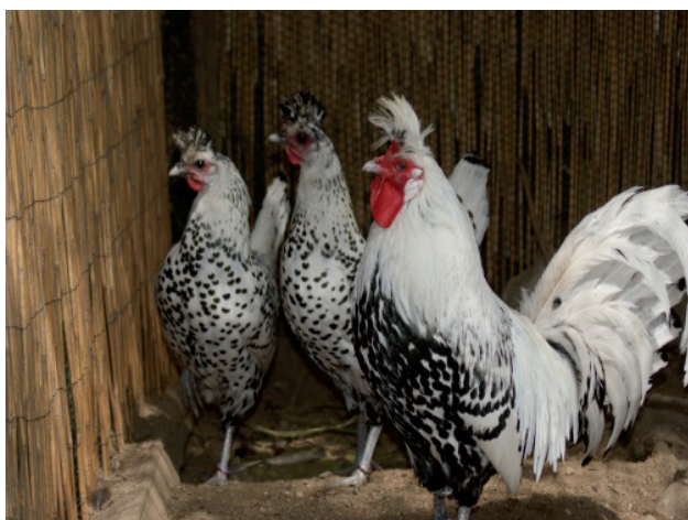
Fot. 3. Kogut i kury rasy appenzeller Phot. 3. Appenzeller rooster and hens

Często też kura sama zakłada gniazdo w miejscu dobrze zakamuflowanym i nieznanym hodowcy, a po okresie wysiadywania wyprowadza pisklęta. Rasa ta jest dość odporna na warunki pogodowe, cechuje ją również dość duża żywotność (Kaszperuk i Różewicz, 2016).