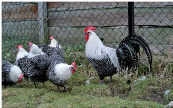
Fot. 7. Kury i kogut rasy brakel odmiany srebrnej Phot. 7. Brakel hens and rooster, silver variety brakel.be

stycznym wzorze (określanym jako paskowanie bądź kreskowanie) z naprzemiennie ułożonych na pojedynczym piórze pasków czerni oraz w zależności od odmiany barwnej – bieli lub złocistego brązu. Najpopularniejsze odmiany barwne brakli to złocista i srebrzysta (fot. 7). Znacznie rzadziej występuje odmiana tzw. wielbłądzia (chamois), u której występuje charakterystyczny dla tej rasy wzór paskowania, jednak w kolorze bieli i barwy jasnozłocistej. Skoki są koloru sinoniebieskiego. Do zalet tej rasy należą, poza oryginalnym wzorem upierzenia, walory użytkowe, gdyż od noski tej rasy pozyskać można do 180 jaj o masie 60–65 g i białej skorupce. Dodatkowo, ptaki te są aktywne i chętnie poszukują dodatkowych źródeł pokarmu. Instynkt kwoczenia występuje sporadycznie.