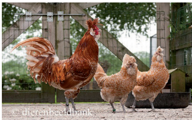
Fot. 6. Kogut i kury rasy brabanckiej Phot. 6. Brabanter rooster and hens levendehave.nl