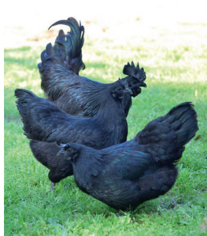
Fot. 4. Kury i kogut rasy ayam cemani Phot. 4. Ayam Cemani hens and rooster