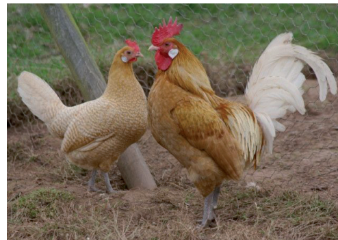
Fot. 8. Kura i kogut rasy fryzyjskiej Phot. 8. Friesian hen and rooster