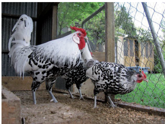
Fot. 9. Kogut i kury rasy hamburskiej Phot. 9. Hamburg rooster and hens

Ciekawą cechą u tej rasy jest różnica w upierzeniu płci osobników przynależnych do tej samej odmiany barwnej. Otóż kogut rasy fryzyjskiej posiada jednolite upierzenie, a kura ma tę samą barwę upierzenia, jednak z bardzo regularnie i symetrycznie rozmieszczonymi cętkami barwy czarnej lub białej (fot. 8).