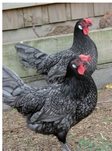
Fot. 2. Kury andaluzyjskie Phot. 2. Andalusian chickens