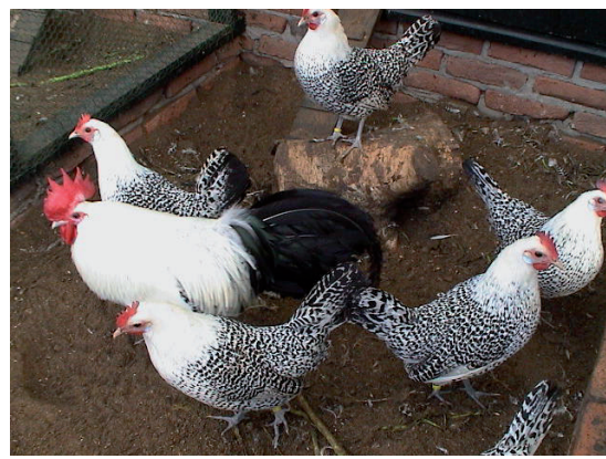
Fot. 10. Kogut i kury mewki wschodniofryzyjskiej Phot. 10. East Friesian Meeuwen rooster and hens

Pomimo ciekawej historii, walorów ozdobnych i użytkowych w Polsce, jak i innych krajach poza Holandią rasa ta nie cieszy się dużą popularnością. Może to wynikać z faktu żywego temperamentu i wrodzonej ruchliwości kur fryzyjskich, w związku z czym wymagają one zapewnienia znacznej przestrzeni i dużej powierzchni wybiegów.