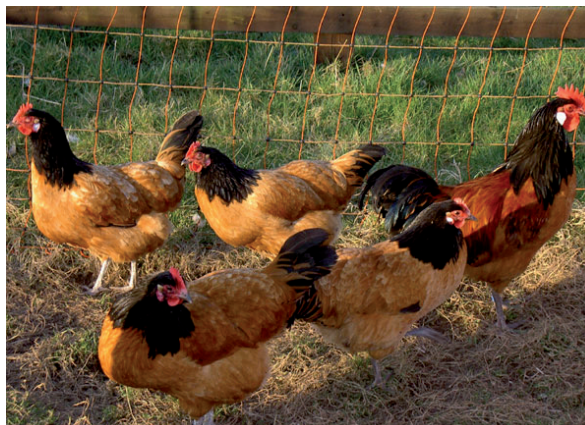
Fot. 12. Kogut i kury rasy vorwerk Phot. 12. Vorwerk rooster and hens