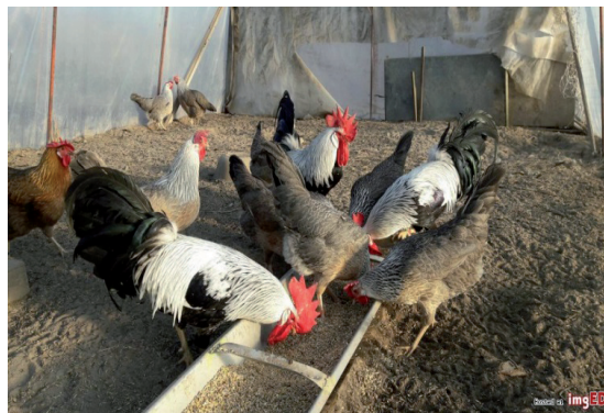
Fot. 14. Kury i koguty rasy włoszka Phot. 14. Italianer hens and rooster imged.pl/

kim niebieskim nalotem. Skoki są niebieskosine. W obrębie tej rasy są dwie odmiany barwne: złota i srebrna. Na głowie i szyi występuje jednolite upierzenie, w zależności od odmiany barwnej – złocistobrazowe lub białe. Tułów natomiast jest charakterystycznie upierzony. Występuje tu kreskowany deseń na piórach, dzięki naprzemiennemu ułożeniu barwy czarnej i – w zależności od odmiany barwnej – złocistobrazowej bądź białej (fot. 13). U koguta pióra siodła są jednak bez charakterystycznego wzoru. Masa ciała koguta waha się od 2 do 2,5 kg, kury od 1,5 do 2 kg. Nioski tej rasy znoszą rocznie 170–200 jaj o białej skorupce i masie 55–60 g.