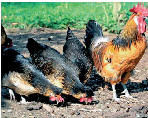
Fot. 5. Kury i kogut rasy brabançonne Phot. 5. Brabançonne hens and rooster