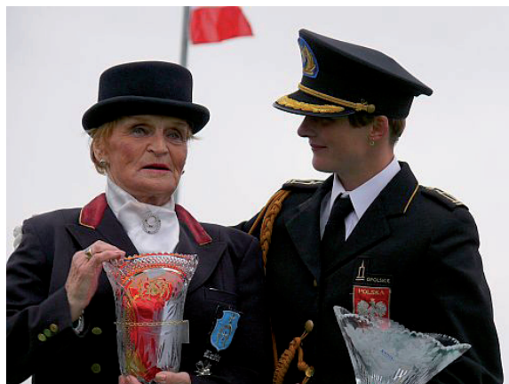
Fot. 7. Ogólnopolskie zawody w ujeżdżeniu, 2–4.05.2008, KJ „LIDER” w Radzionkowie Phot. 7. Polish Dressage Competition, 2–4 May 2008, riding club “Lider” in Radzionków ( http://www.stajniatrot.pl/texts/wydarz/2008/rad0805.html )